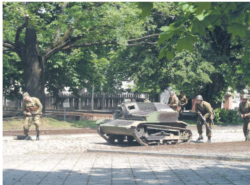
Inscenizacja ataku polskiej piechoty w 1939 roku ze wsparciem tankietki TKS – Konwent Grenadier Warszawa Cytadela 2013 rok