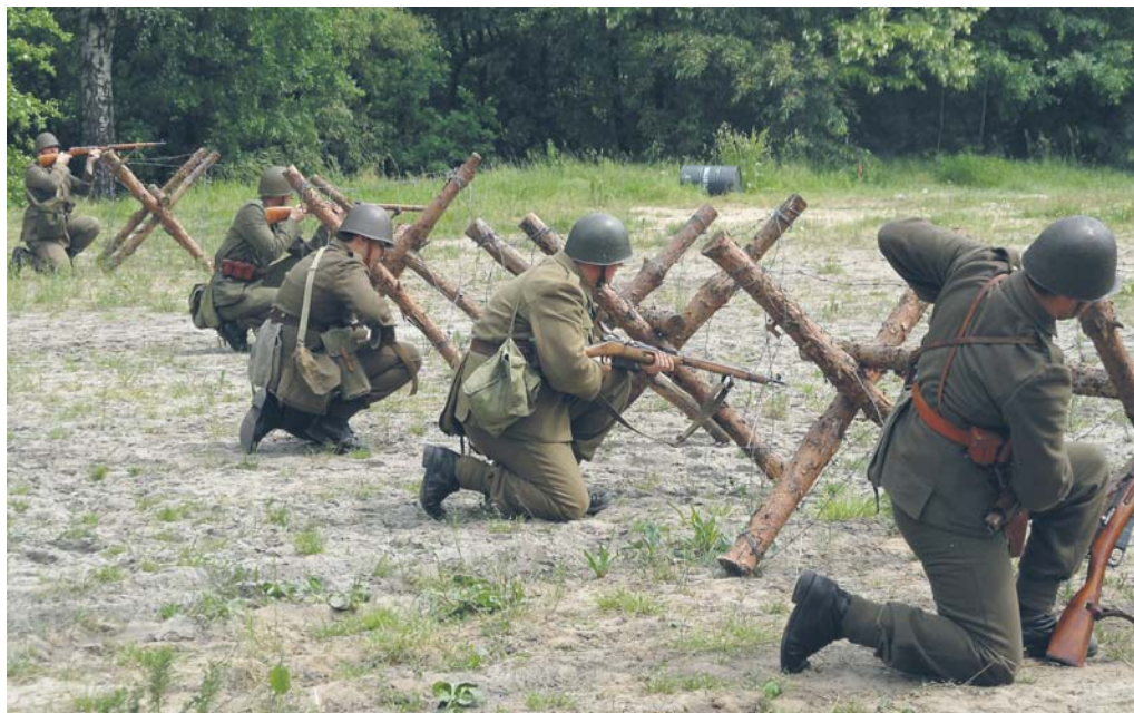
Inscenizacja natarcia polskiej piechoty w 1939 roku – Konwent Grenadier Warszawa Fort Bema 2014 rok